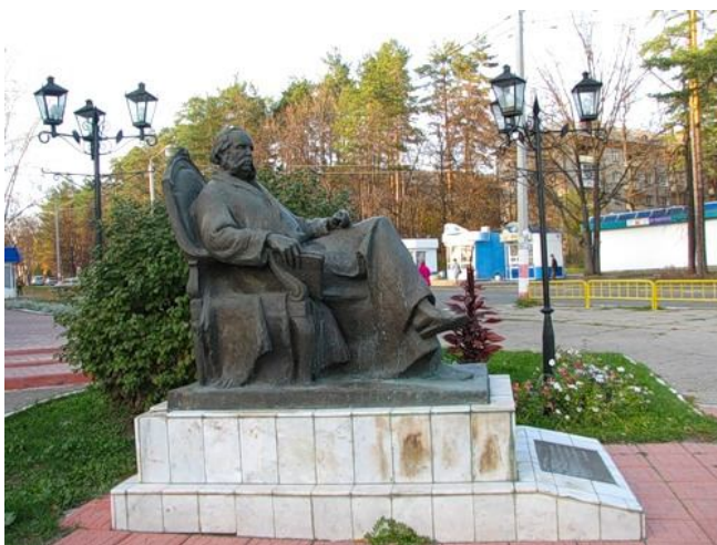
en Dimitrovgrad (skulptisto I.Zamedjanskij)