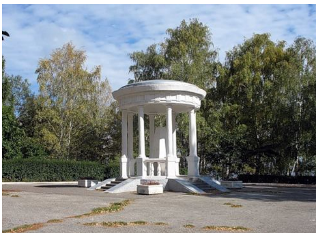
Malnova Gonĉarov-laŭbo en Vinnovskij parko