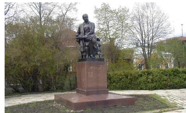
Monumento al Gonĉarov (skulptisto L.Pisarevskij)

Vivo ŝanĝiĝas, ĝia movo akceliĝas, tempo de romantikaj pigruloj delonge dronis en la eterna forgeso. En moderna mondo, tumultema kaj impetega, ne estas loko por kontemplema pigreco.