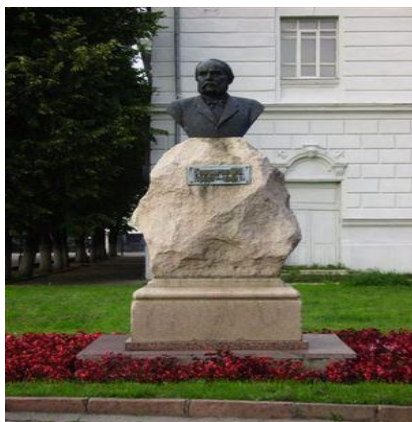
Monumento al I.A.Gonĉarov en Uljanovsk (skulptisto A.Vetrov) kaj