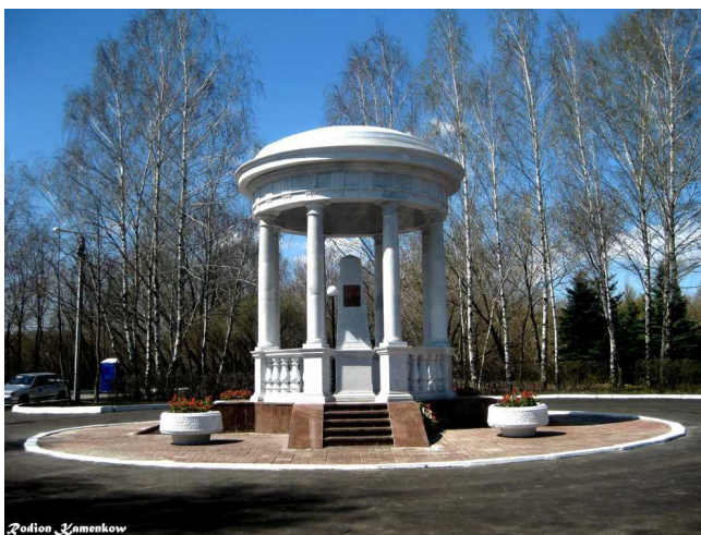
Tiamaniere ĝi aspektas nun