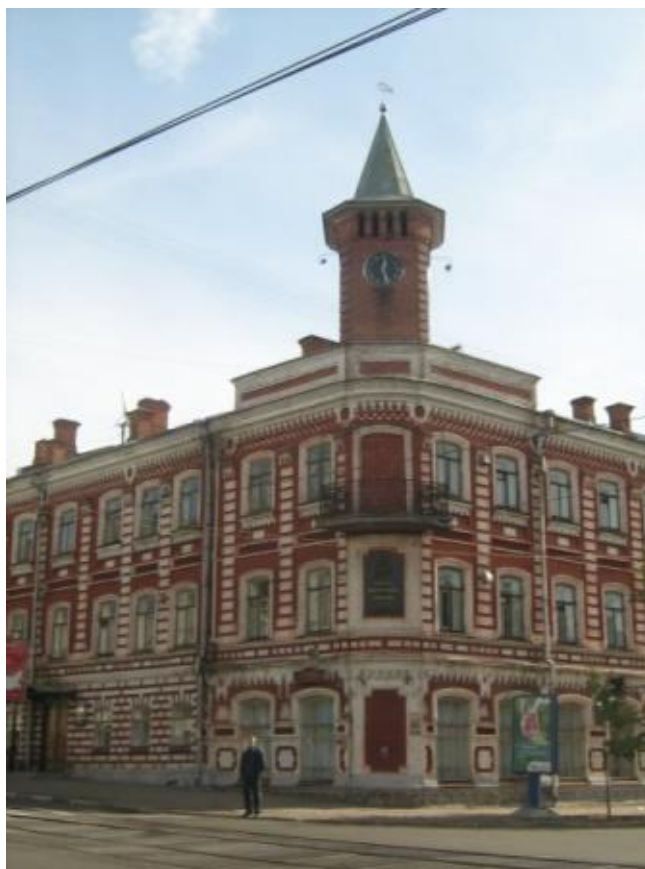
Nuna aspekto de la domo. Ĉi tie lokiĝas Gonĉarov-muzeo

Nun la memoron pri tiu granda verkisto oni zorge gardas en lia patrolando. La domo de Gonĉarov fariĝis muzeo, kiu konatigas siajn vizitantojn kun vivo de lia fama loĝanto, lia familio kaj liaj samtempuloj, ekzemple tie estas angulo de Oblomov kun nepra divano, ĥalato kaj araneaj retoj. La fama domo kun horloĝo, kiu ĉiam montras ĝustan tempon iĝis simbolo de nia urbo. En Uljanovsk kaj Dimitrovgrad estas starigitaj monumentoj al Gonĉarov, kaj belforman laŭbon sur bordo de Volga oni konsideras kiel rendevulokon de liaj herooj. Liaj verkoj estas prezentataj en la Uljanovska drama teatro, kaj certe legataj kun granda intereso kaj plezuro.