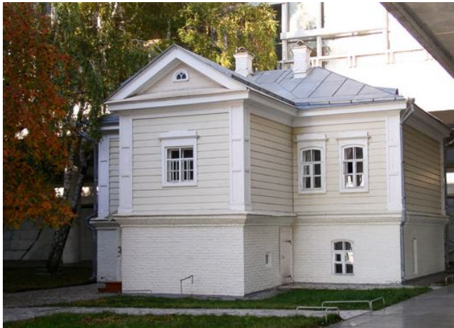
En tiu ĉi domo naskiĝis V.I.Lenin la 22-an de aprilo 1970.