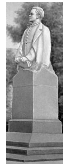
Tiu monumento al gimnaziano Volodja Uljanov (1954, skulptisto V.E.Cigal) staras sur placo antaŭ malnova stacidomo

En 1948 ĝi ricevis nomon de Lenin. Multaj ĝiaj lernantoj iĝis famaj: S.A.Buturlin, ornitologo; V.V.Kavrajskij, hidrologo; I.V.Kurĉatov, fizikisto; V.P.Filatov, okulisto kaj multaj aliaj. La konstruado aperis en la jaro 1790 (arkitekto I.Toskani). De 1809 ekzistis porvira gimnazio. En 1990 ĉi tie malfermis siajn pordojn muzeo “Simbirska klasika gimnazio” (en apuda domo, konstruita en 1883).