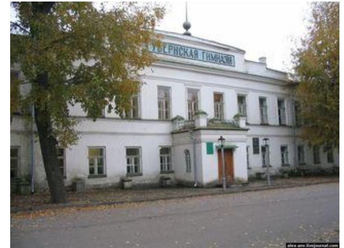
Gimnazio, kie lernis juna Volodja .

Lia patro Ilja Nikolajeviĉ inspektis popolajn lernejojn. En 1957, kiam estis la 125-a jubileo de Ilja Nikolajeviĉ, oni inaŭguris monumenton (skulptisto M.G.Manizer), kiu estas proksime de lia tombo. Tio estas busto de I.N.Uljanov. En la piedestalo oni faris elstarajon, tie staras malriĉa kampula knabo en bastoŝuoj kaj kun libro. Tombo de I.N.Uljanov estis en vivmonaĥeja tombejo. Sur la monumento estis malfermita libro.