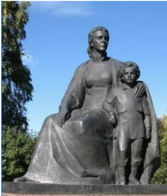
Apude staras nun monumento al lia patrino (1970, skulptistoj P.Bondarenko, O.Komov, Ju.Ĉernov, O.Kirjuhin)

Domo-muzeo de Lenin. Ĉi tie loĝis la familio de 1878 ĝis 1887. La muzeo estas fondita la 10-an de decembro 1923. La gefratoj de Lenin partoprenis tiun aranĝon.