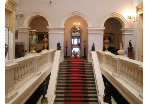
Ĉefŝtuparo al la dua etaĝo

En la dua etaĝo estas arta muzeo. Tio estas unu el la plej antikvaj muzeoj de Volgia regiono. Ankaŭ ĝi estis fondita de V.N.Polivanov en la jaro 1895. Nun en la muzeo estas pli ol 10 mil eksponaĵoj: unika kolekto de pentrarto, skulptarto kaj grafikarto.