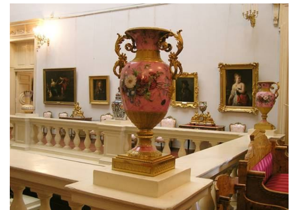
Ekspozicio de okcidenteŭropa pentrarto