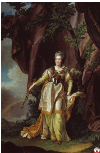
”Portreto de Jekaterina la Dua” de D.G.Levickij (1787)

Antikva rusa kolekto enhavas ikonojn de la 16-20 jarcentojn. La muzeo precipe famas pri pentraĵoj de rusaj pentristoj D.G.Levickij, F.S.Rokotov, V.L.Borovikovskij, I.I.Ŝiškin, A.K. Savrasov, I.I. Repin kaj aliaj.