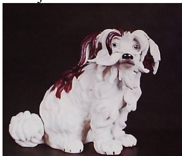
Hundeto. La dua duono de XIX jc. (Rusio, fabriko de Popov)

Valoras belega kolekto de porcelano el Rusio, Germanio kaj Francio.