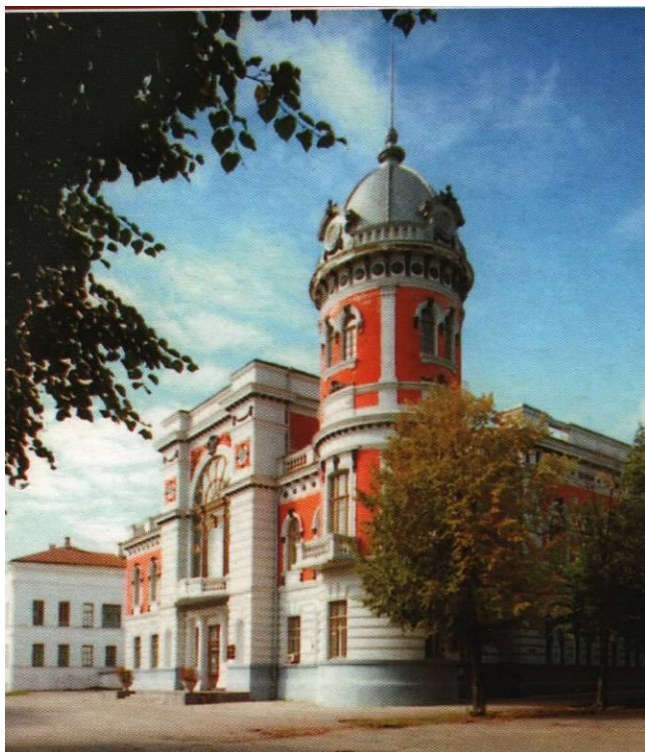
Arta kaj regionstuda muzeoj

La domon oni konstruis per popolaj mondonacoj en 1914 memore al Ivan Aleksandroviĉ Gonĉarov (1812-1891), okaze de la centjara jubileo de la verkisto. Arta muzeo situas en la dua etaĝo, regionstuda muzeo – en la unua. Arta muzeo enhavas rimarkindan kolekton de pentraĵoj de grandaj pentristoj. Inter ili estas multaj originaloj.