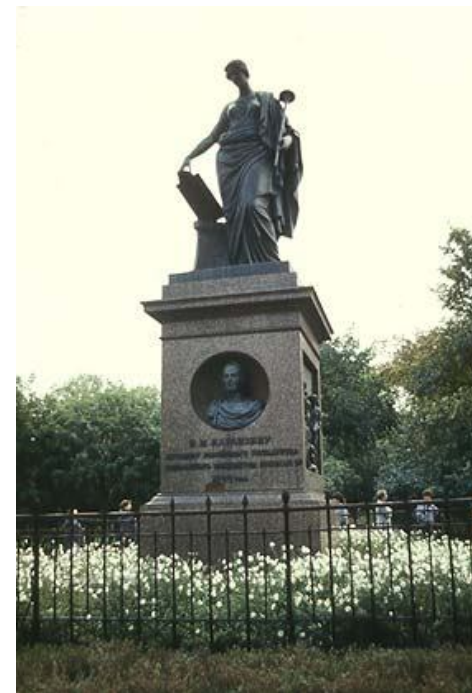
La monumento al Karamzin muzo. Lia busto modeste troviĝas en la niĉo