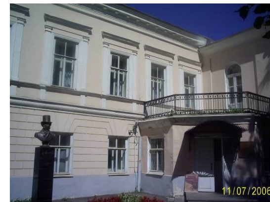
La domo de Nikolao Jazikov, poeto de Puŝkina plejado, deklarinta sin “poeto de ĝojo kaj ebrio” En 1833 tie gastis A.S.Puŝkin vojaĝinte por serĉi materialon por «Historio pri Pugaĉov»