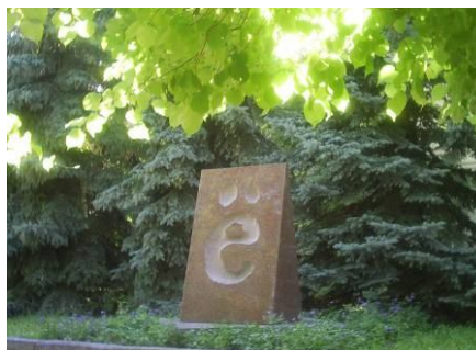
Nur en nia urbo estas monumento al litero “ë”[jo]

Unu el vidindaĵoj estas monumento al Karamzin, kreinto de la “Historio pri Regno Rusia”, kiu aldonis al la rusa alfabeto literon «ë».