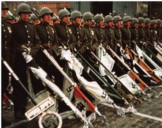
La 24-an de junio 1945 116 uljanovskanoj partoprenis faman Paradon de Venko en Moskvo

Honoron kaj suverenecon de nia Patrujo defendis 268 mil uljanovskanoj. Pli ol 125 mil pereis, mortis pro vundoj kaj malsanoj kaj pereis senpostsigne.