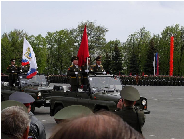
La 9-an de majo en Uljanovsk

Sur alta bordo de Volga troviĝas obelisko. Ĝi estis starigita en la jaro 1975 kaj memorigas nin pri tiuj, kiuj oferis sian vivon por ni. Tie brulas eterna fajro memore al falintaj herooj.